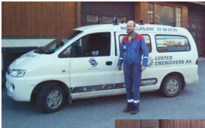
I 2002 investerte Luster Energiverk i 6 nye bilar.