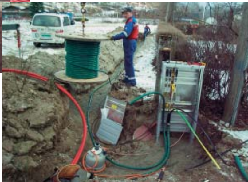
Norvald Sandvik legg fiberrøyr og lågspenkabel ved barneskulen i Gaupne.