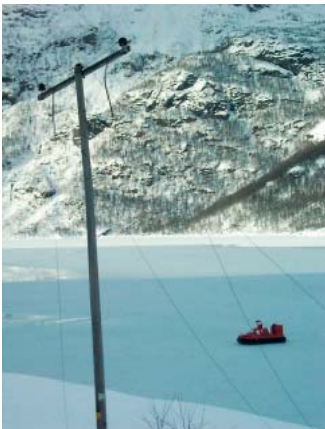
Ras tok linja på Veitastrond den 01.02.02