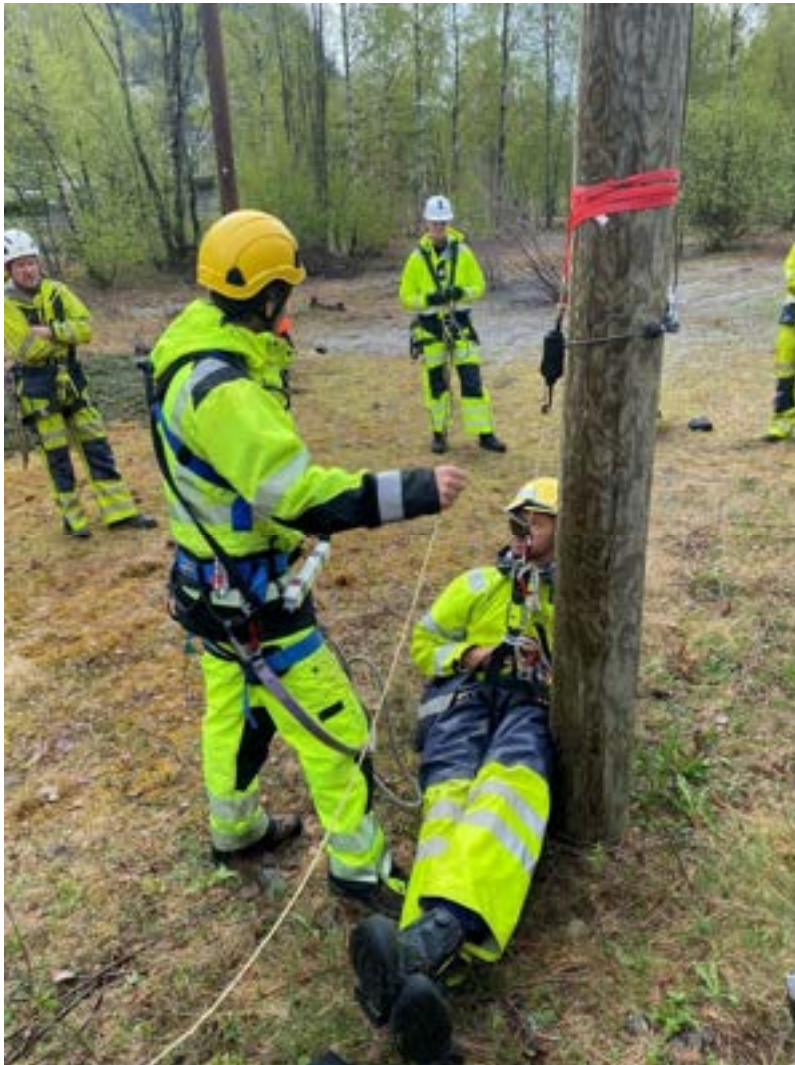
Nedfiringskurs for våre tilsette