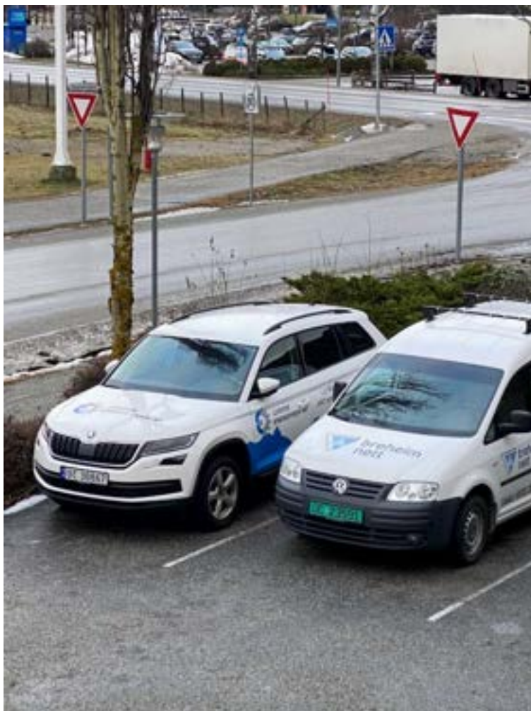
Omprofilering til Breheim Nett