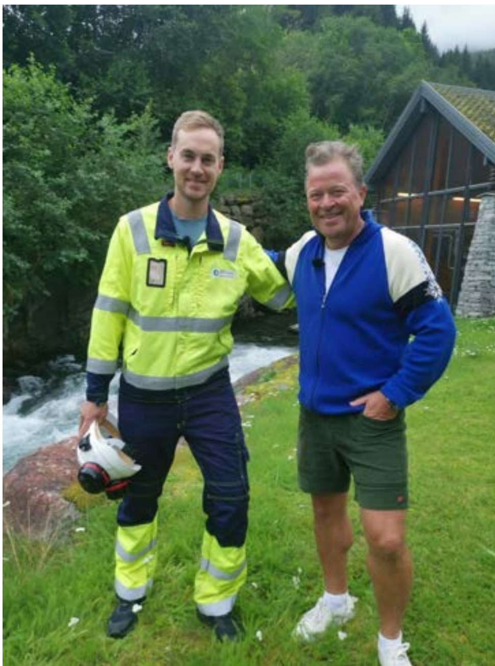
Innspeling av tv-program på Kvåle kraftverk