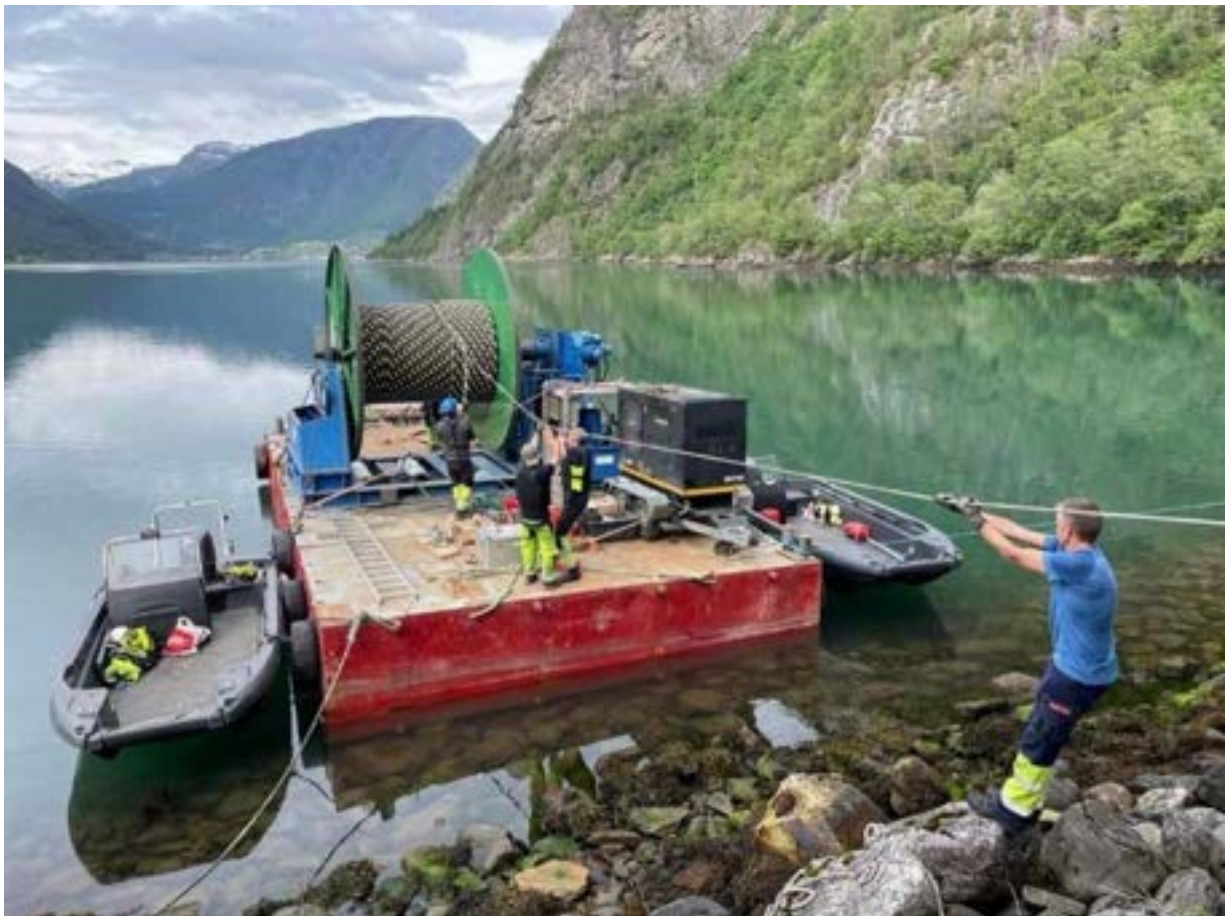
Legging av sjøkabel